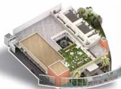
2 ÈME ÉTAGE