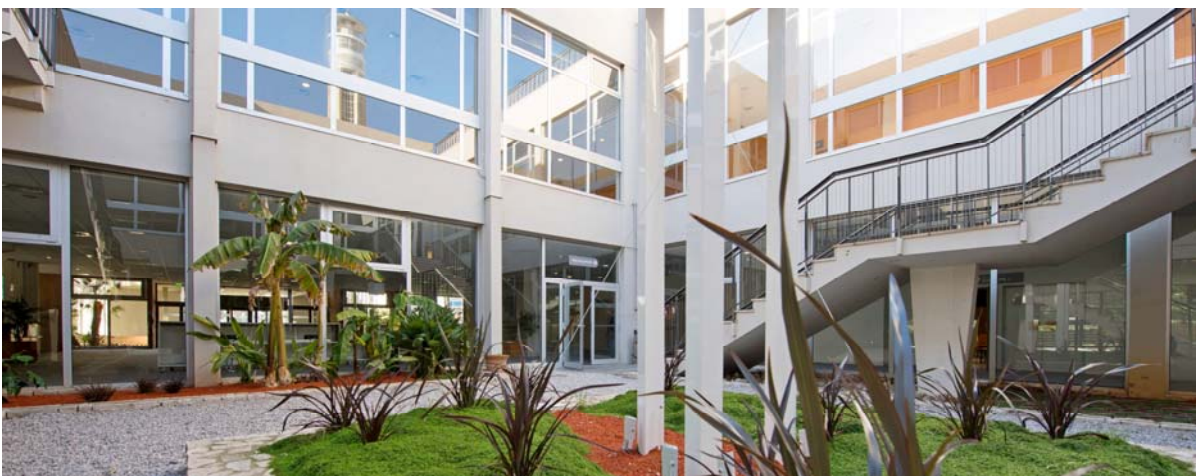
Le Patio permet, par beau temps, d'accéder directement au Hall Accueil Expo du 1 er étage Direct access to the 1 st floor thanks to the Patio