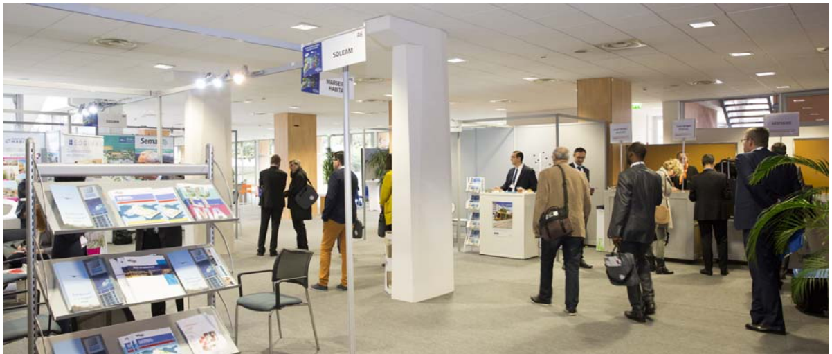
Pour les expositions, il est conseillé de ne pas reposer de moquette par-dessus la moquette existante du rez de jardin – Salon du Congrès des EPL– (Fédération des EPL – SAFIM / BRUIZ) For exhibitions, we advise not to put any carpet on the existing one.