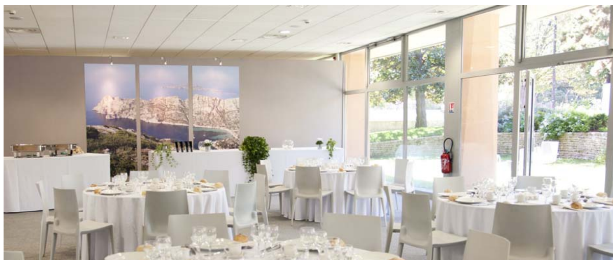
Au fond, construction d'un espace traiteur complémentaire au local existant