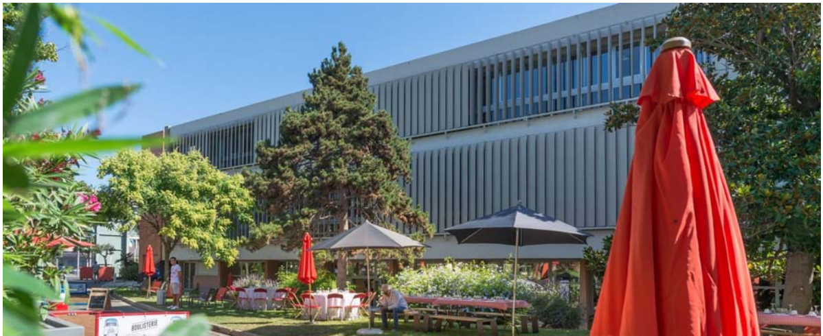
Restauration dans le jardin – SYT 2017 Seated lunch in the garden