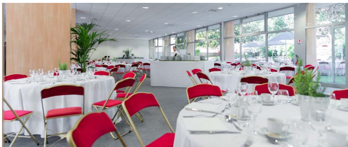
Espace Restauration – SYT 2017