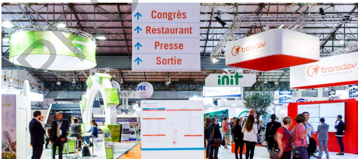
Rencontres Nationales du Transport Public

Any rigging project must be approved by Chanut, the organizer must provide rigging project at least 10 business days before the first set-up day, Rigging is not possible if there is snow on the roof (during end of November till end of April period).