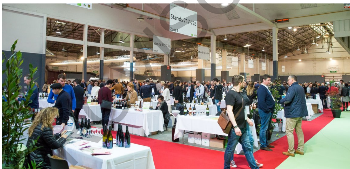
Salon Millésime Bio