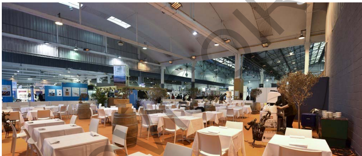
Salon Food In Sud Espace restauration

Le local traiteur n'est pas un lieu de stockage ; il peut cependant, et à titre exceptionnel, être utilisé pour entreposer du petit matériel, des cartons (le stockage de rack alu ou autre matériel lourd ou susceptible de dégrader le local est strictement interdit).