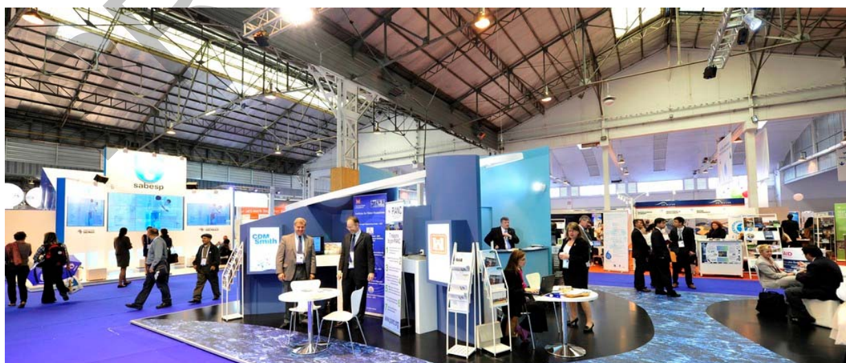
Forum Mondial de l'eau