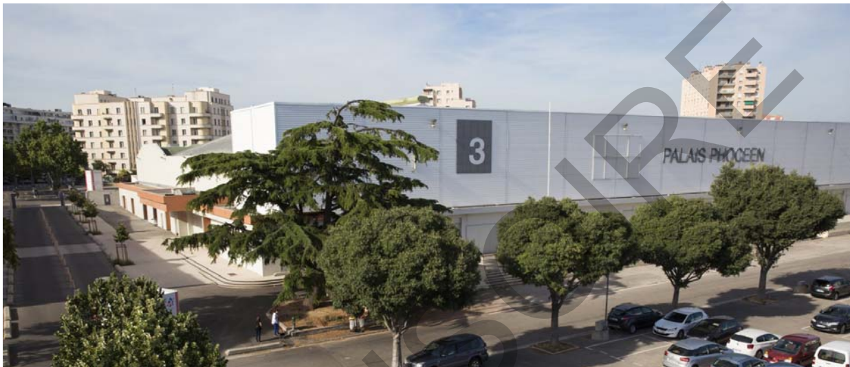
Façades sud et Ouest

Heating system allows use during cold weather.