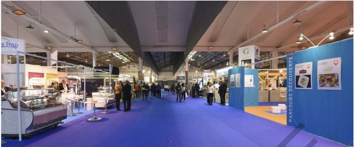
Salon Food In Sud ©2016 Cook and Shoot By A. GERARD - Volume libre Unequipped safety area