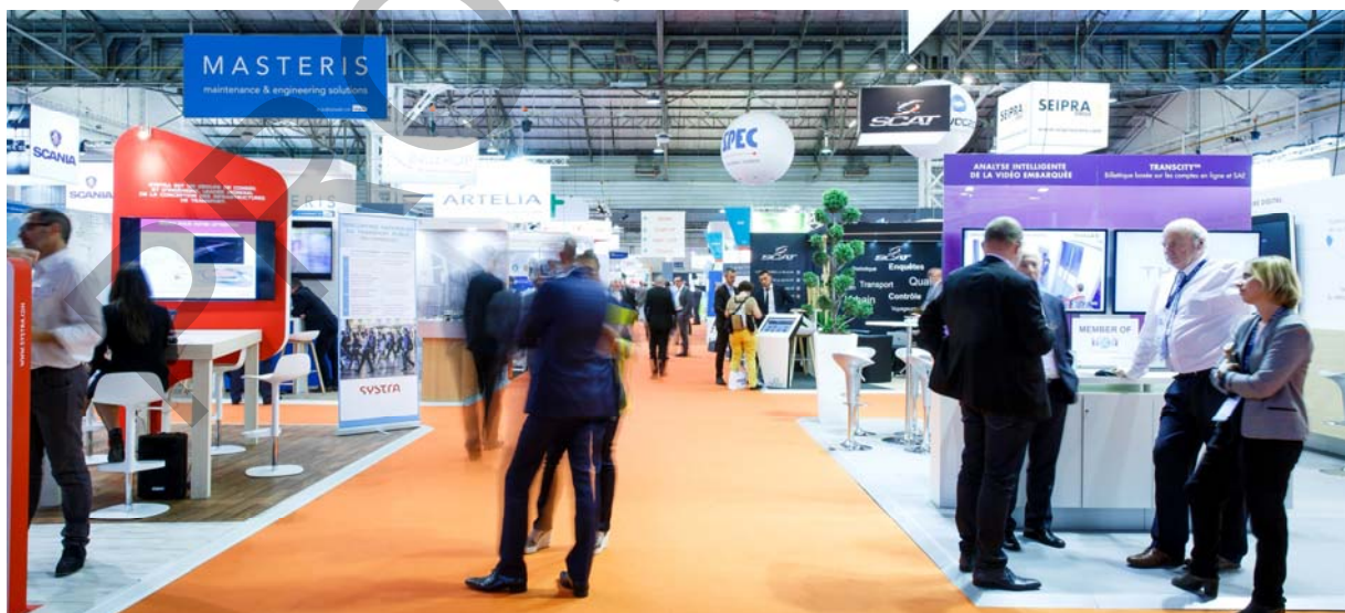
Les Rencontres Nationales du transport public